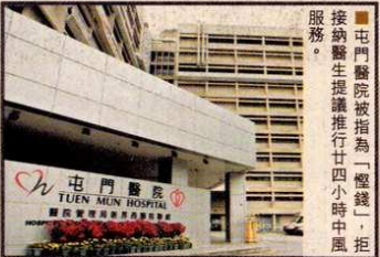
屯門醫院被指為「慳錢」，拒絕醫務局推行廿四小時中風服務。