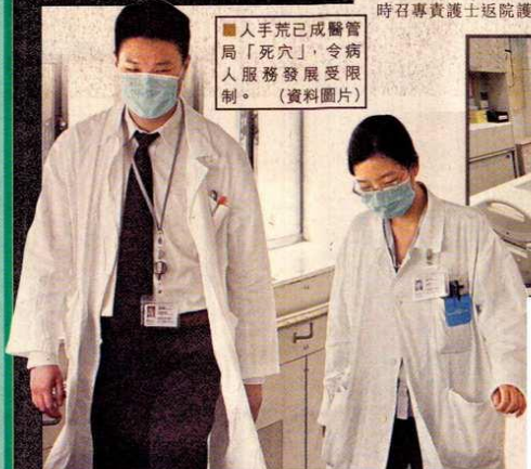
人手荒已成醫管局「死穴」，令病人服務發展受限制。(資料圖片)

另外，食物及衛生局局長周一嶽昨指，關注屯院內科部門一年內四分一人手流失，如有需要或從其他聯網調配人手。內科醫生與其他專科比較，晉升較遲，加劇離職情況。現時每年有二百五十名醫科生畢業，兩年後將增至三百二十人。 ■記者梁麗兒